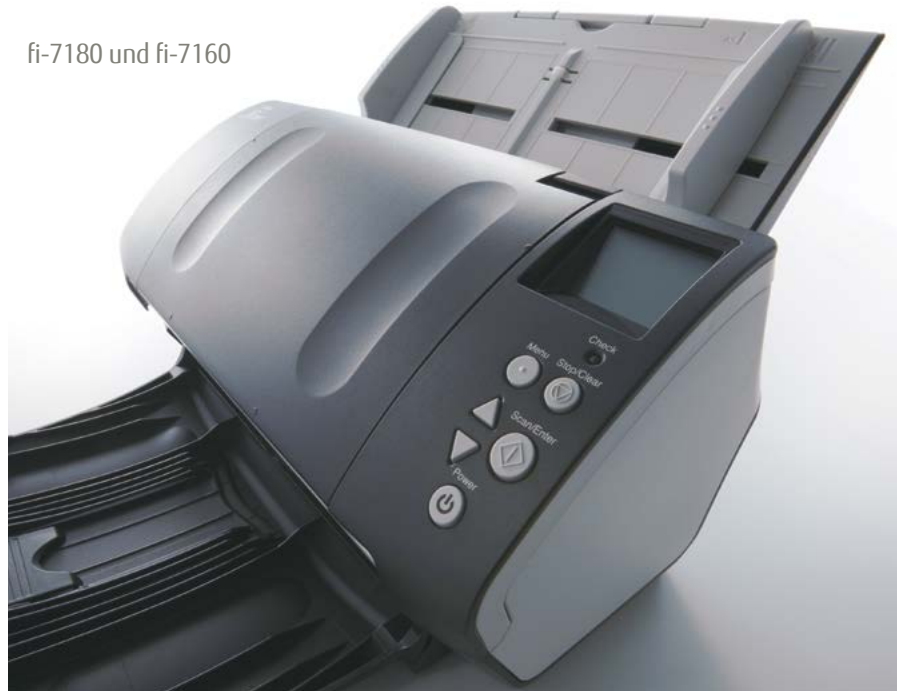
fi-7180 und fi-7160