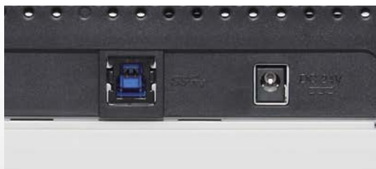
Hohe Geschwindigkeit über USB 3.0 Schnittstelle