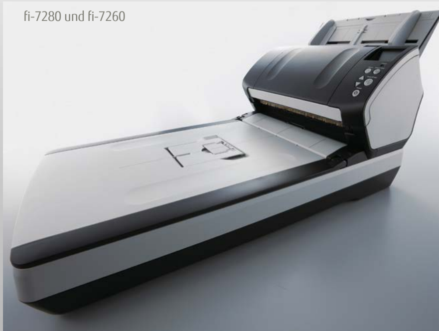
fi-7280 und fi-7260

Trägerfolien Trägerfolien ermöglichen das Scannen von Dokumenten größer als A4, oder von Fotos und empfindlichem Beleggut. {Artikelnummer – PA03360-0013}